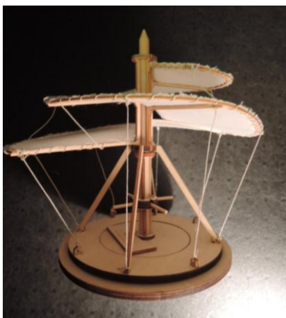
Modell 2: Flugschrauber