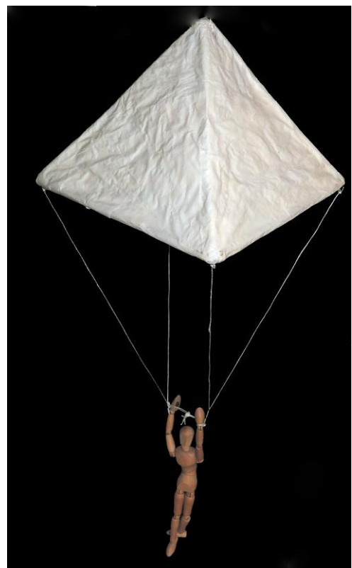
Modell 3: Fallschirm