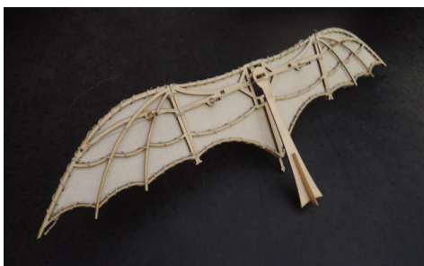
Modell 1: Flugapparat nach Vogelflug-Studien