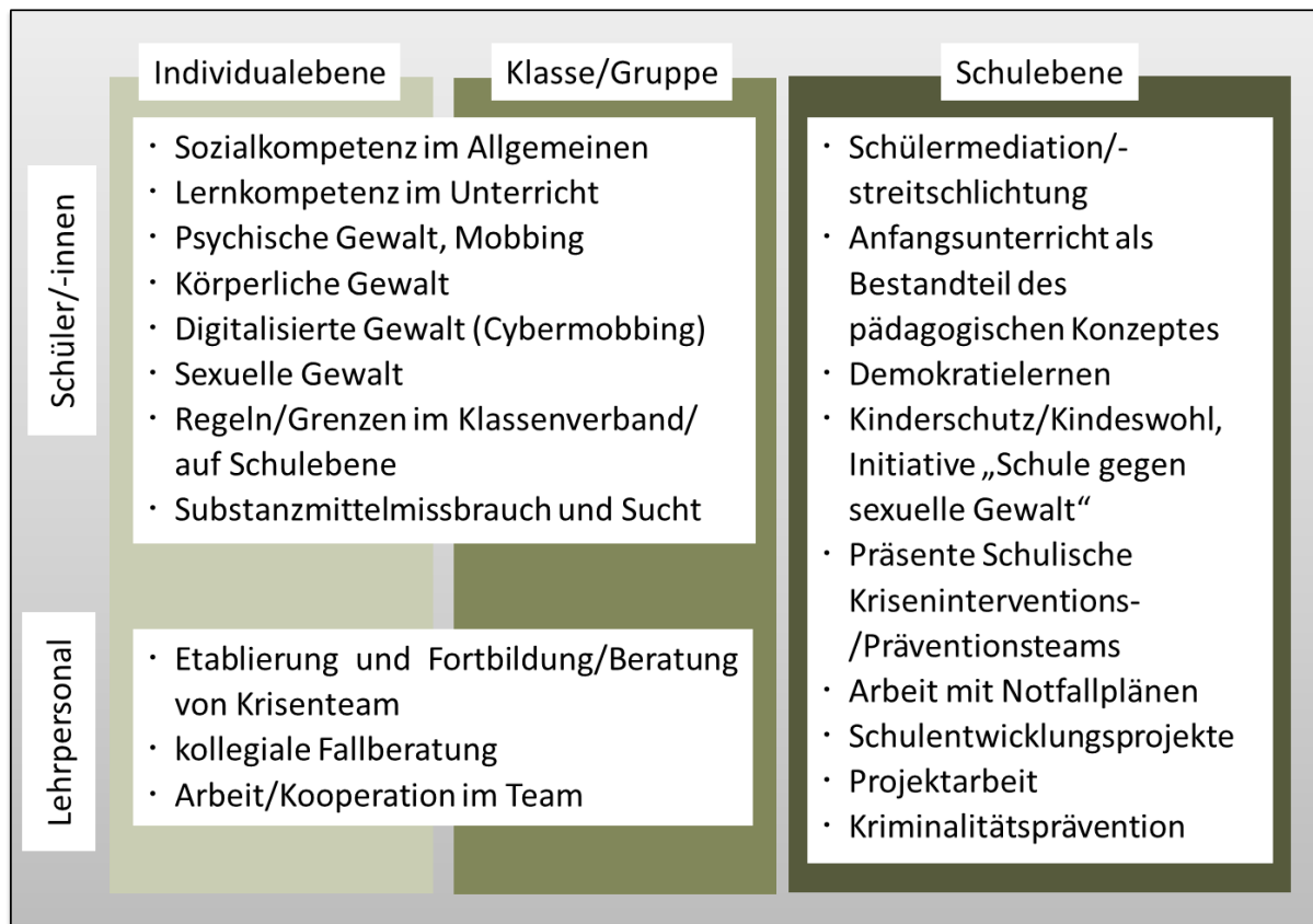
Abbildung 2. Übersicht über mögliche unterrichtsimmanente und zusätzliche Präventionsangebote.

scher oder auch sexueller Gewalt. Diese Präventionsprogramme/Präventionsmaterialien richten sich an ganze Klassenverbände oder aber definierte Schülergruppen.