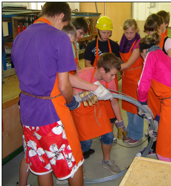
Abwickeln des Drahtes von der Rolle