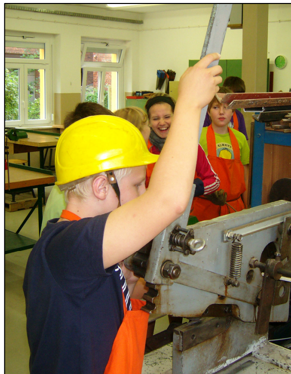
Abtrennen einzelner Drahtstücke