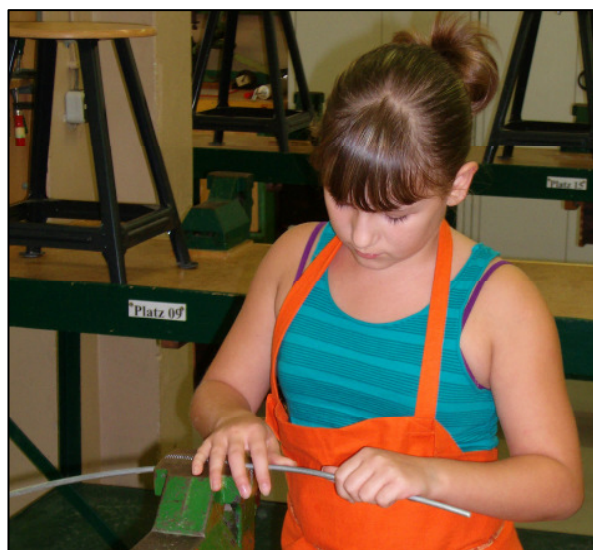
Richten des Zeigers