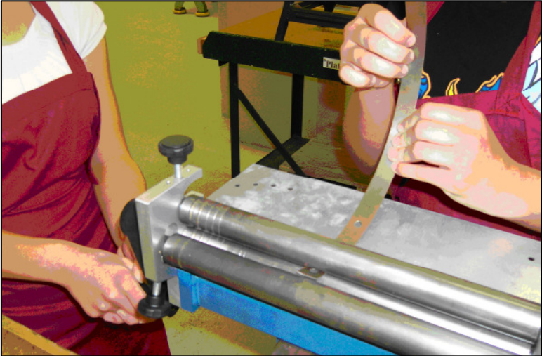
fertig umgeformtes Ziffernblatt nach dem 25. Walzstich