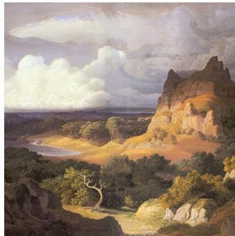
Meine "heroische Landschaft"