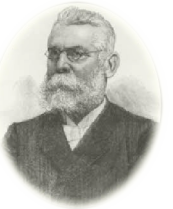
Hermann Gruson 1821-1895