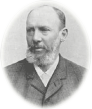
Rudolf Wolf 1831-1910