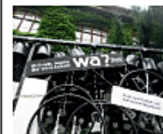
„Wa?“ – an diesem Wort erkennt man, wer aus Halle stammt. (Halle im Garten der Neuen Residenz Nähe Domplatz)