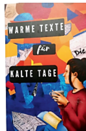
Auszüge aus „Warme Texte für kalte Tage“ (Lucas-Cranach-Gymnasium Wittenberg 2022)

„Was soll die Welt verändern, wenn alles so bleibt, wie es ist?“