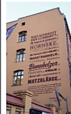
Schöne halleische Wörter an der Fassade des Feininger-Gymnasiums Halle (Nähe Hallmarkt)