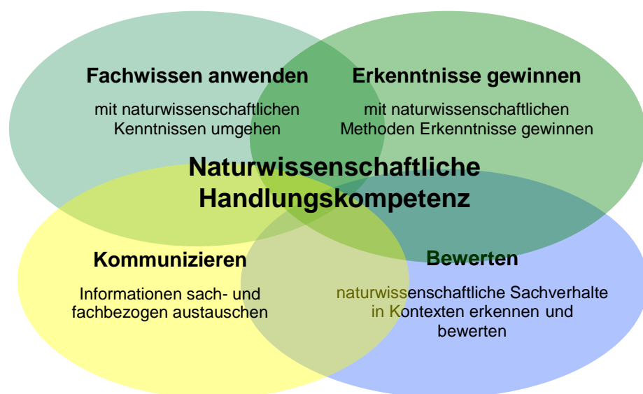
Abb. 1: Kompetenzmodell der Fächer Astronomie, Biologie, Chemie und Physik