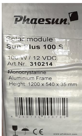
Abb. 2 Technische Daten eines Photovoltaikmoduls