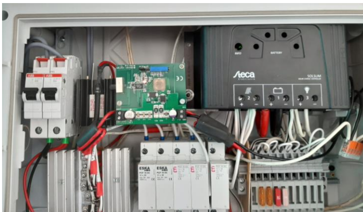
Abb. 3 Bauteile einer Solaranlage