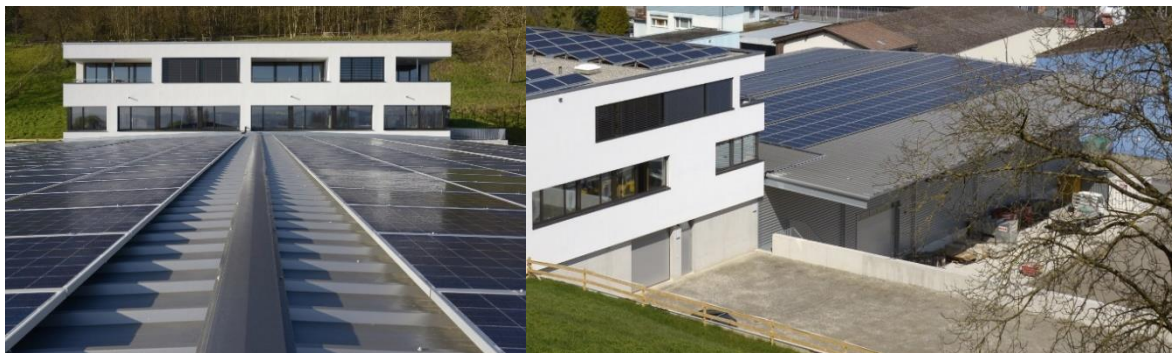
Abb. 1. Bürogebäude mit Werkhalle

Die Auftragslage für einen Einzelunternehmer entwickelt sich langfristig so gut, dass er sein Unternehmen erweitert. In diesem Zusammenhang ist es notwendig, dass nicht nur die Produktionsstätten und das Bürogebäude modernisiert und erweitert werden, sondern auch internetfähige Maschinen eingeführt werden. Der Einsatz rechnergestützter Maschinen verlangt die Einhaltung bauklimatischer Randbedingungen. Die Organisation der Fertigung muss überarbeitet werden. Der Unternehmer fühlt sich der Nachhaltigkeit verpflichtet und ist bestrebt, seine innerbetriebliche Transportflotte mit selbstproduziertem Solarstrom zu betreiben.